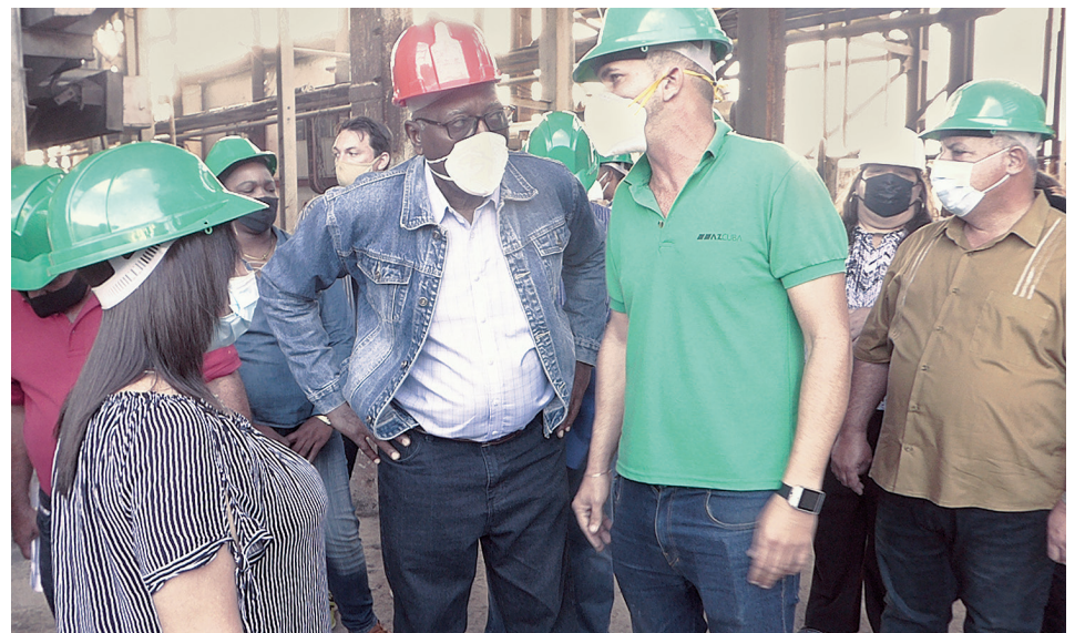
En el central azucarero Antonio Sánchez, de Aguada. / Fotos: del autor

namiento productivo del “Antonio Sánchez” con otras entidades aledañas debe seguirse en el país, amén de recabar un esfuerzo extra, sin dejar de reconocer que se trata de un ingenio ubicado en la fila de la vanguardia cubana.