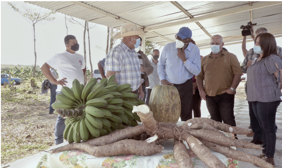
En el polo agrícola El Dajao, de Rodas.

Durante el segundo segmento de su amplia jornada de trabajo, Valdés Mesa sostuvo un encuentro de trabajo en la sede del Gobierno Provincial, donde fueron evaluados —entre otros temas— la implantación de la nueva estructura organizativa en la administración municipal del Poder Popular en Cienfuegos, el cumplimiento de la campaña de frío y el plan de primavera.