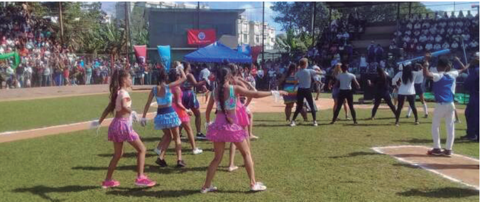
Excelente gala organizaron los anfitriones. / Foto: del autor

Otros momentos de gran emoción se vivieron con la entrada de la antorcha por el aniversario del Inder, portada y escoltada por glorias deportivas del territorio, así como el retiro oficial de directivos que han dedicado toda su vida al deporte.