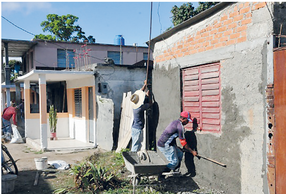
En la provincia, más de mil 500 viviendas de comunidades vulnerables serán beneficiadas con acciones constructivas.