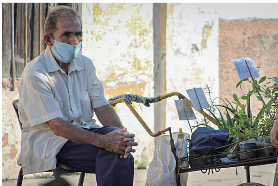
Hoy día muchos jubilados extienden su vida laboral, mientras otros asumen trabajos informales para poder subsistir.

jubilados que vivían solos y devengaban la pensión mínima sin ayuda económica de ningún familiar obligado. Por dicho concepto, la nación erogó mil 900 millones de pesos, equivalentes a 79 millones de dólares, según un reporte de la agencia Prensa Latina.