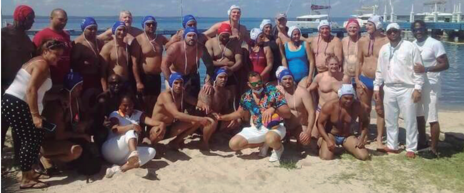
Esta es la segunda visita de los holandeses a Cienfuegos.

Polistas Máster de Holanda visitaron nuestra provincia para efectuar partidos con sus homólogos de Cienfuegos, aunque a la postre otros veteranos del país, involucrados en la Liga Nacional de Polo Acuático, también se sumaron a la fiesta y jugaron en defensa de uno y otro plantel.