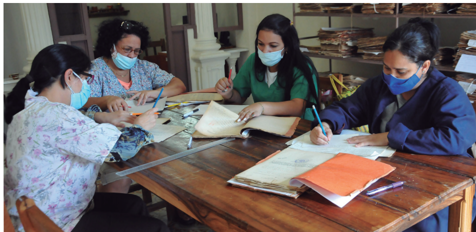
Grupo de procesos técnicos del AHP en la descripción del Fondo Tribunal de Urgencia.

corresponde ejecutar los procesos de automatización y digitalización de los fondos y colecciones de la institución y crear bases de datos para un mejor servicio en línea por la web”.