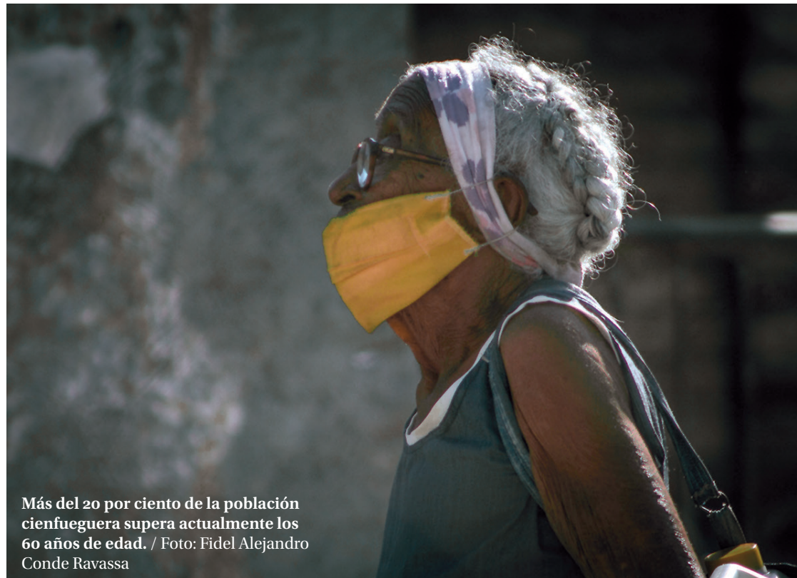
Más del 20 por ciento de la población cienfueguera supera actualmente los 60 años de edad.

Tal tendencia alcanza otros picos en Cienfuegos, donde —según datos de la Dirección