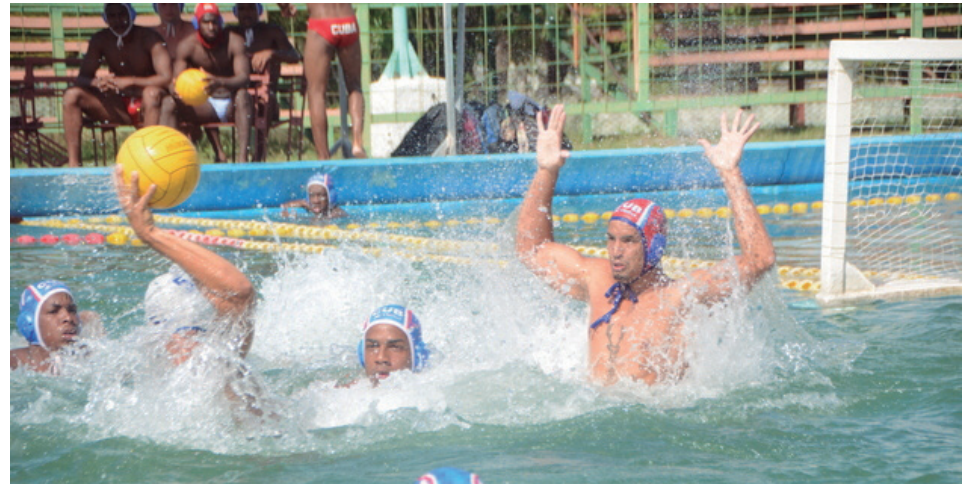
De manera invicta los locales se llevaron la corona.