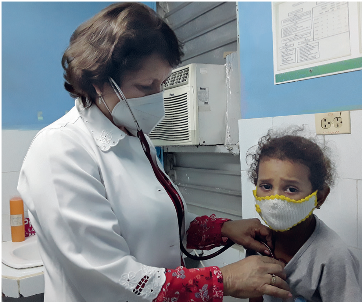
Un niño enfermo es su responsabilidad, auscultación a cambio de un caramelo.