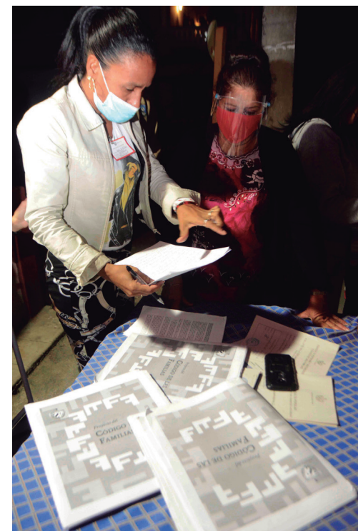
Debate en la circunscripción No. 132, de Reina.