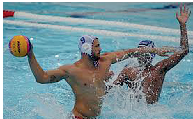
Los polistas de Cienfuegos van por su corona nacional número 22 en forma sucesiva.

El evento tiene como principal objetivo evaluar a figuras que pudieran integrar las representaciones de Cuba al premundial femenino y, en el caso de los varones, al preclásico que organiza México. (C.E.CH.H.)