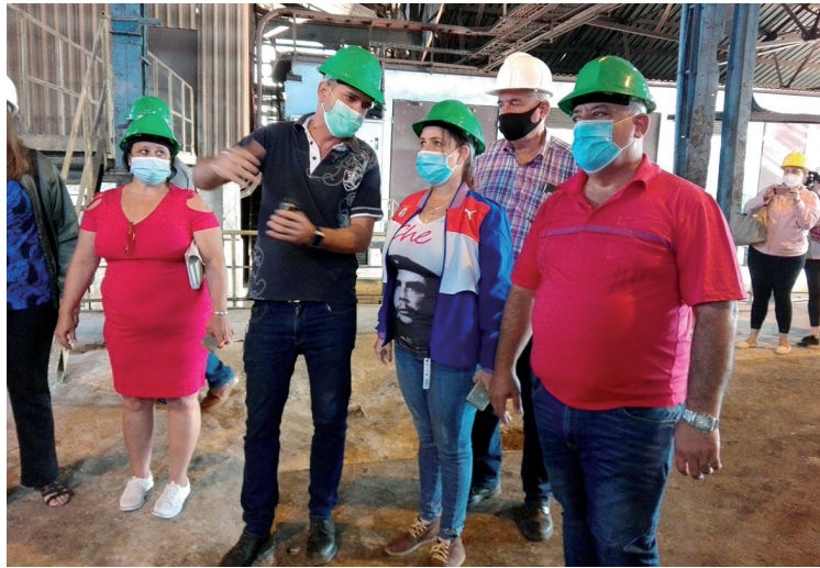
Autoridades de la provincia en el "Antonio Sánchez".

Otra de las tareas evaluadas por las máximas autoridades de la provincia fue la siembra de caña, cuyo cumplimiento en ambas empresas en el mes de enero auguran vencer a la postre este imprescindible componente del programa cañero azucarero, con vistas a, más temprano que tarde, autoabastecerse de la gramínea en las venideras zafras.