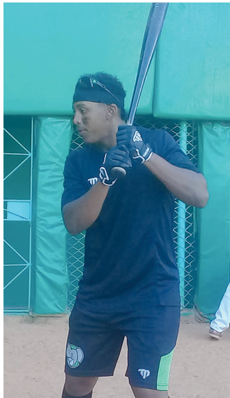
El novato se ha visto muy bien en el jardín central. / Foto: del autor

“Siempre me he desempeñado en la pradera derecha, pero hablaron conmigo debido a las