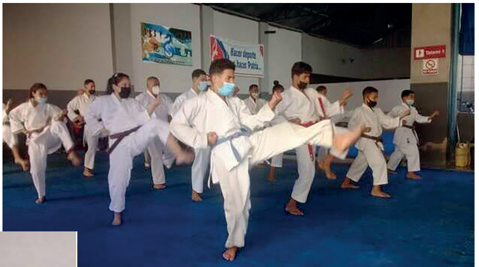
Varios atletas del Alto Rendimiento se presentaron al examen de Alto Nivel, algo inédito para la disciplina.

Rendimiento poseen una técnica envidiable. Hoy Matanzas, Guantánamo, Camagüey, La Habana y Cienfuegos sirven de ejemplo para el resto de las provincias”.