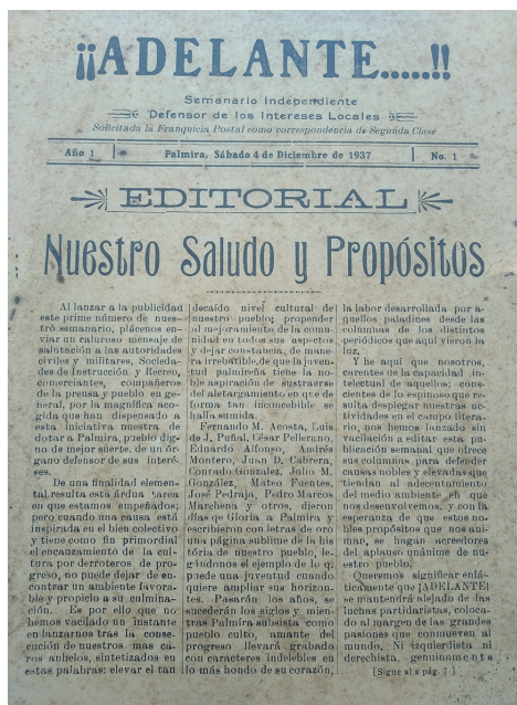
Primer número del semanario ¡ADELANTE...!! , sábado 4 de diciembre de 1937.