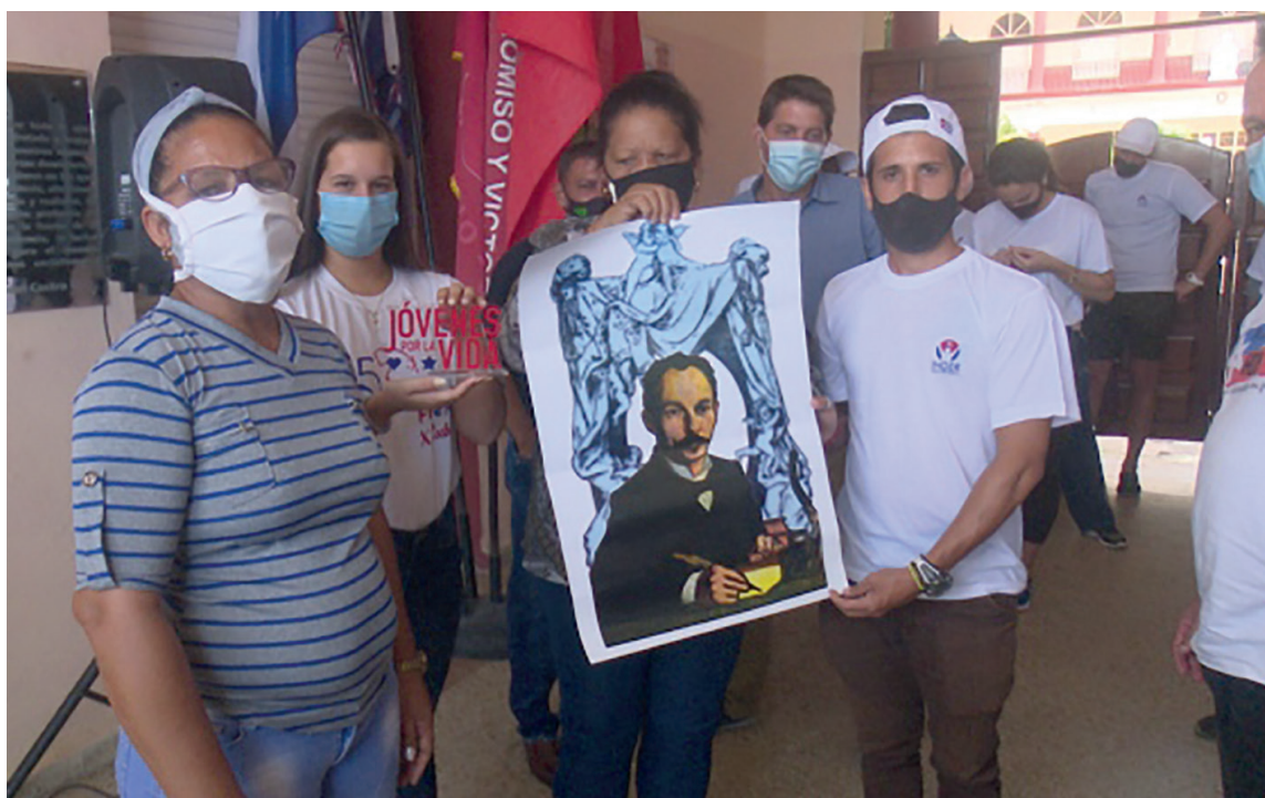
La Eide mereció la distinción Jóvenes por la Vida debido a su contribución en el enfrentamiento a la Covid-19.

“A pesar de que la actividad deportiva se vio paralizada desde el punto de vista de competencias y entrenamientos habituales, nuestros atletas no descuidaron la preparación. Desde sus hogares, utilizando los medios a su alcance, y siempre bajo la supervisión de sus entrenadores, trataron de mantener la forma para, en el momento del retorno, no llegar en cero a las prácticas. Aquí fueron determinantes las nuevas tecnologías, las mismas que utilizamos para comunicarnos con los atletas nuestros que se encuentran contratados en el exterior; los que competían internacionalmente, y aquellos que se mantuvieron por momentos en los Centros Nacionales de Alto Rendimiento. Porque a pesar de la difícil situación epidemiológica, logramos garantizar la preparación de los deportistas que tomarían parte en los eventos fundamentales del año. Y así