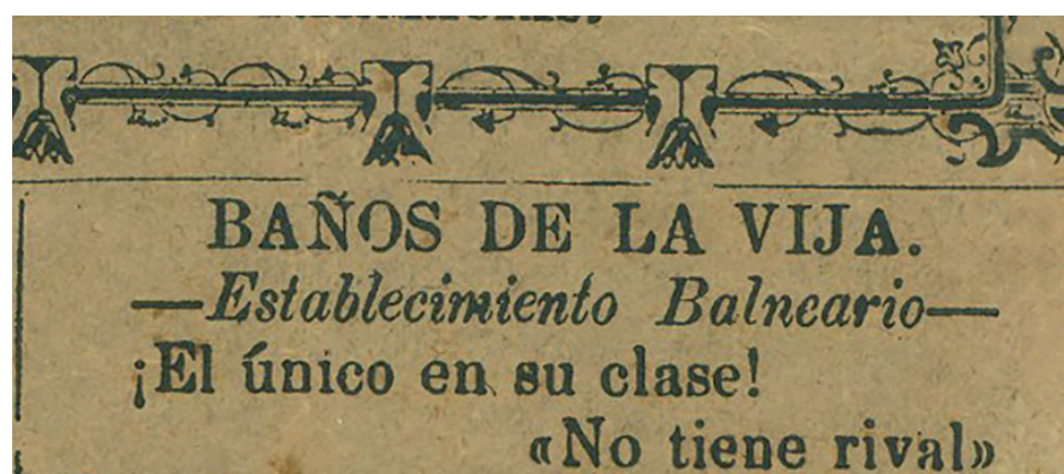
Encabezado de la columna de promoción sobre La Bija, señalado en La Berengena de 1885.