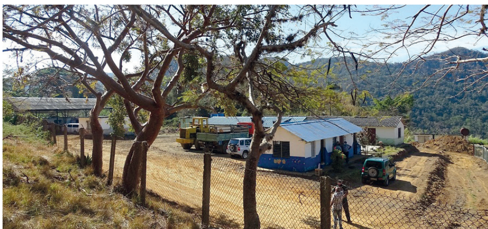
Grupo de Ejecución de la Montaña de la Ecoing No. 12.

La empresa ha ubicado en su Grupo de Ejecución de la Montaña la maquinaria necesaria para materializar proyectos que consoliden el bienestar social de los montañeses, y que sentarán las bases para el desarrollo progresivo de importantes fuentes de ingresos con vistas a nutrir la economía en la provincia.