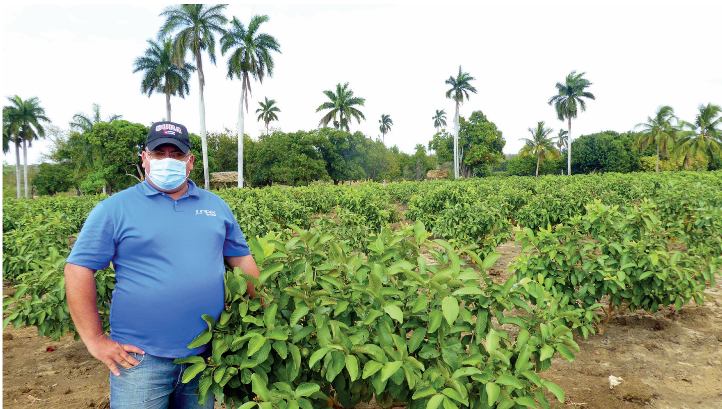
La guayaba, junto al mango, representa una de las de mayor desarrollo dentro de sus 32 líneas de frutales.

Lo último piensa realizarlo, dice, a partir del uso de la luz solar, en pos de minimizar los gastos energéticos. Esta es la filosofía de trabajo suya: la optimización. Lo hace con las minindustrias, mas también con los cultivos varios, donde el intercalamiento constituye premisa inviolable.