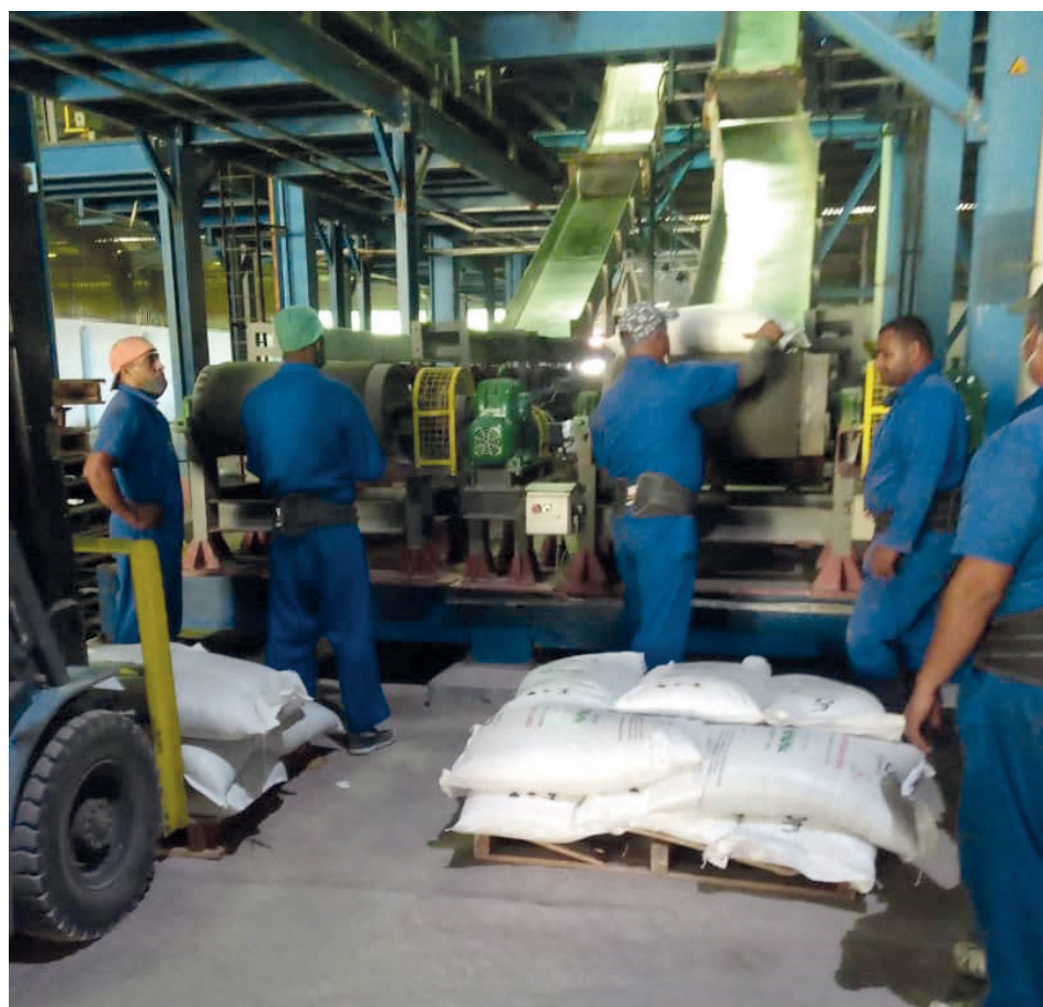
Esta foto y las otras dos muestran el proceso productivo en la “NPK”.