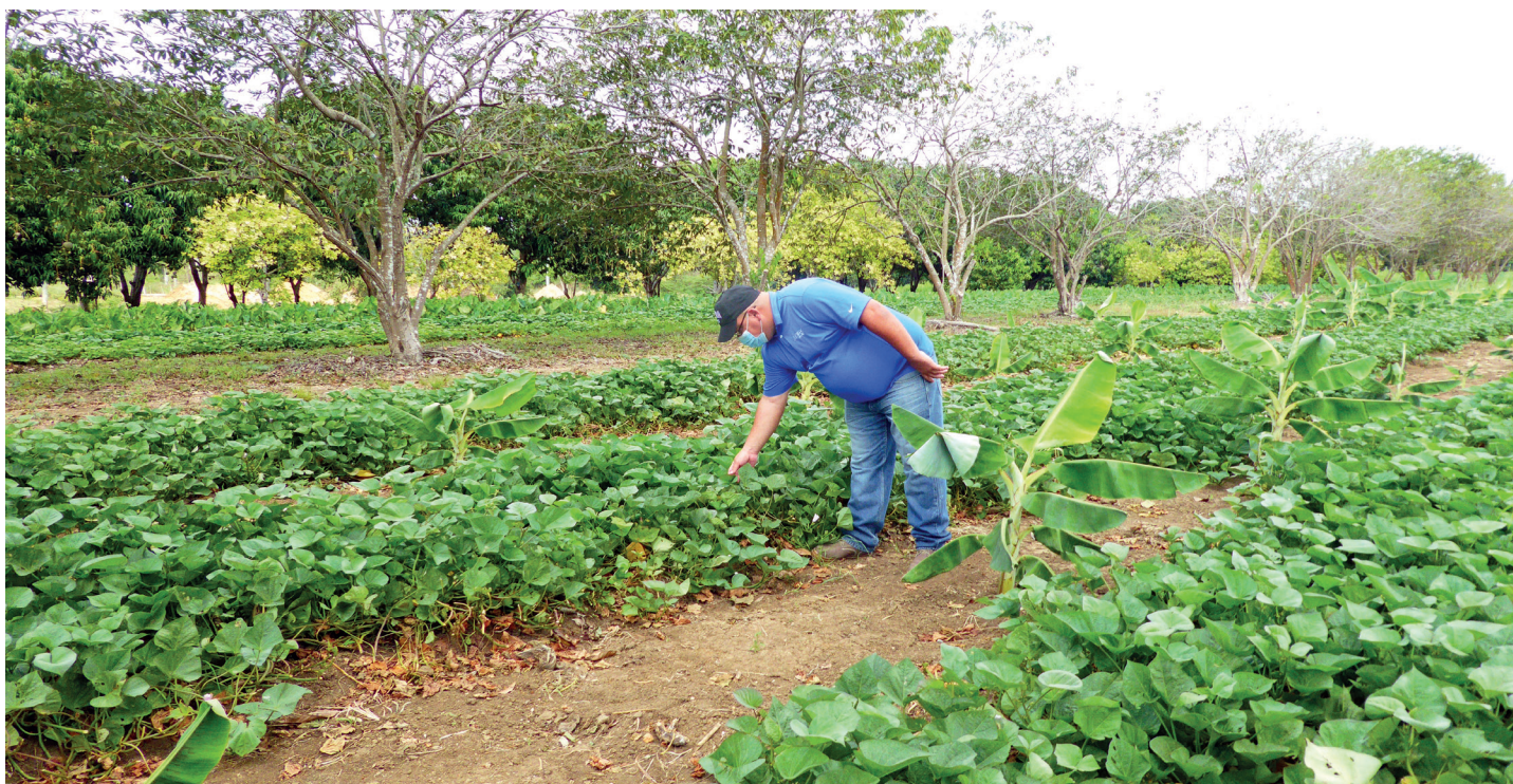
El intercalamiento es básico en sus tierras. En la foto, boniato con plátano entre las calles. Al fondo se aprecian cultivos de chirimoya, marañón y mango, en igual orden.