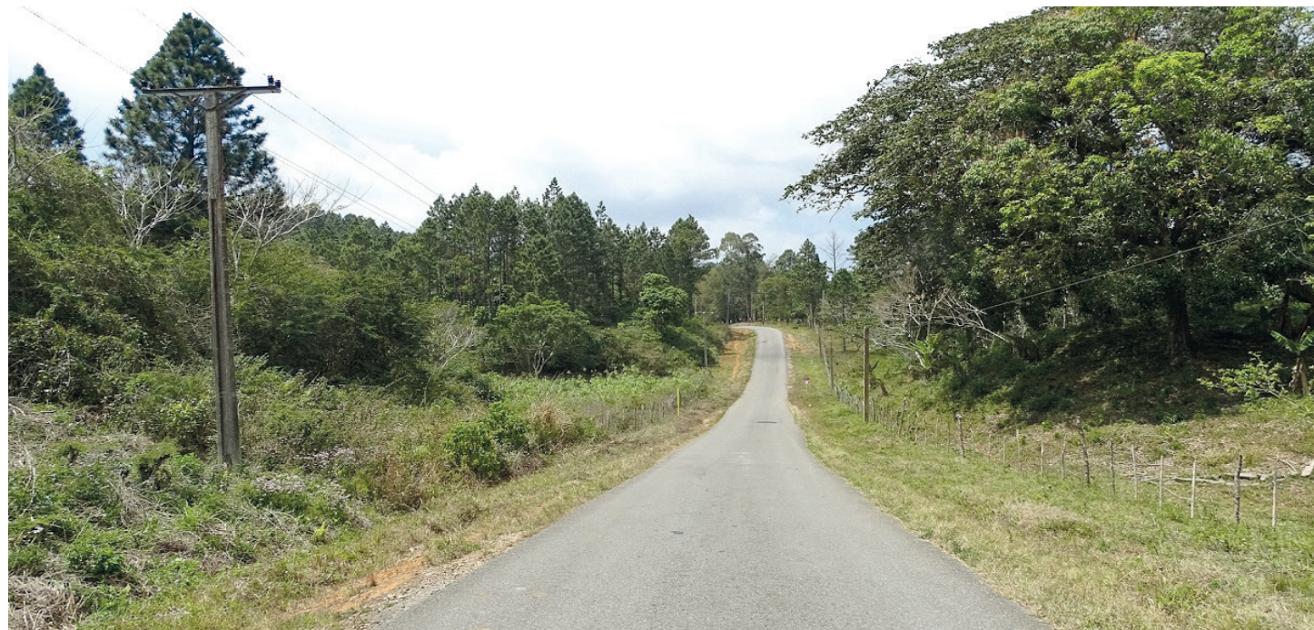
Más de 25 kilómetros del Anillo de la Montaña fueron reparados en 2020.

Unas 3 mil personas que habitan en esta zona rural se benefician con esta red de carreteras. Además de reforzar el impacto social de su labor, el fortalecimiento del GEM sitúa a la Ecoing No. 12 en un contexto de integración empresarial que busca el avance del territorio. “Estamos trabajando en función del encadenamiento productivo”,