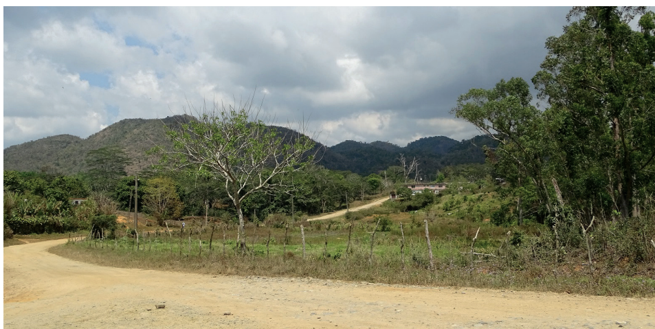
La construcción del vial de acceso a la comunidad de El Sopapo II, entre las proyecciones de la Ecoing No. 12.