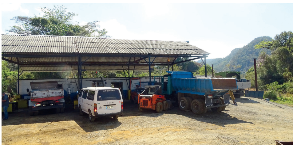
La ampliación del Taller de Maquinaria es una de las acciones de la expansión del Grupo.