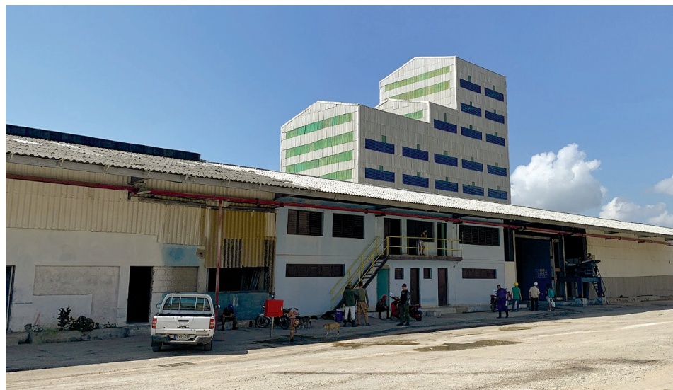
Fábrica de Fertilizantes Mezclados NPK, de Cienfuegos.

Se prevé que la Fábrica de Fertilizantes Mezclados NPK cienfueguera, la mayor de su tipo en el país, cierre 2021 con una producción cercana a las 44 mil toneladas. Aunque, la capacidad instalada le permitiría alcanzar las 300 mil t de un producto vital para el despegue de los rendimientos agrícolas en la Isla.