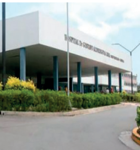
Hospital Provincial Dr. Gustavo Alderúa Lima (HGAL), de Cienfuegos.