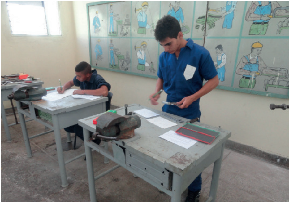
No existe ninguna correlación entre la infinidad de graduados de la enseñanza técnico-profesional y la presencia de practicantes de oficios en Cienfuegos.