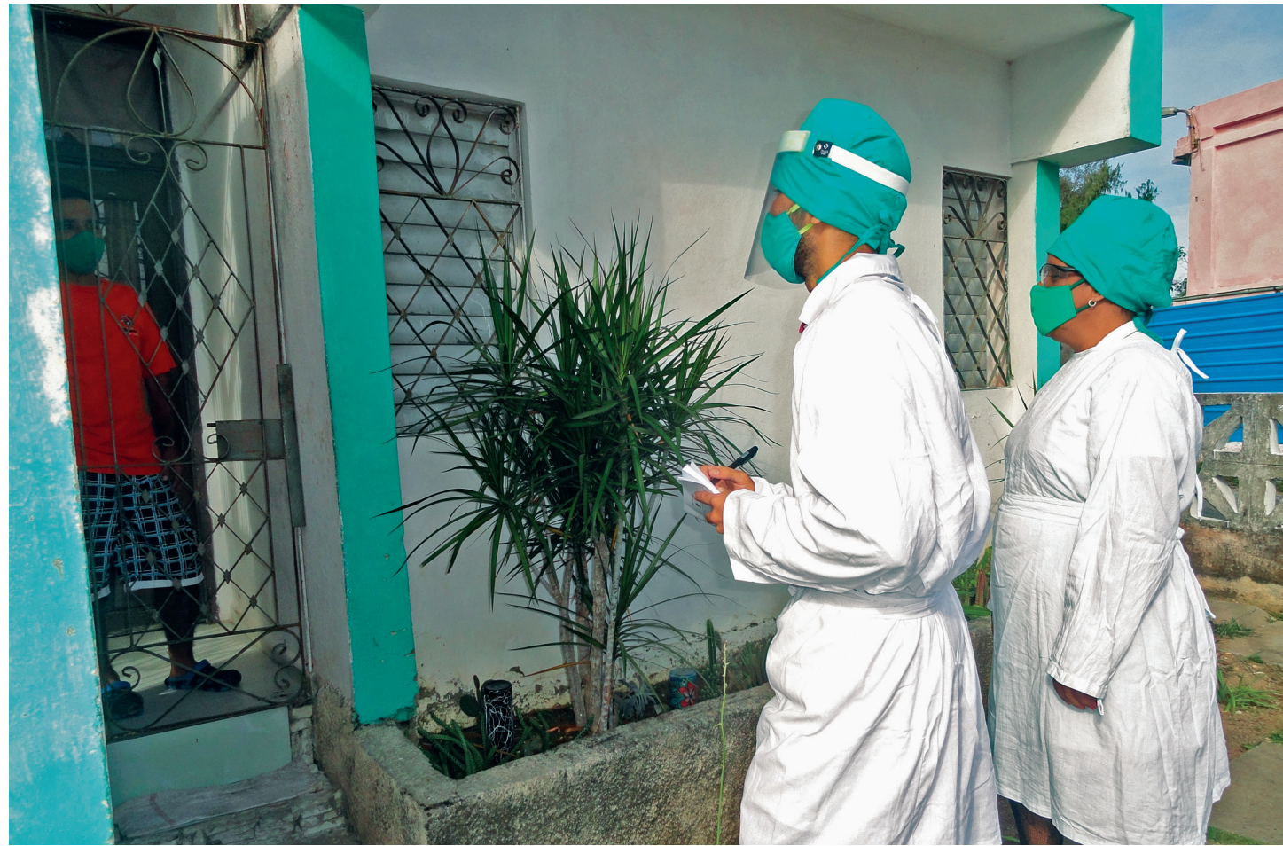
Visita del médico y la enfermera de la familia a una vivienda en aislamiento.

“Desde la DPS se controlan y manejan las estadísticas del comportamiento de la pesquisa activa, con el monitoreo de