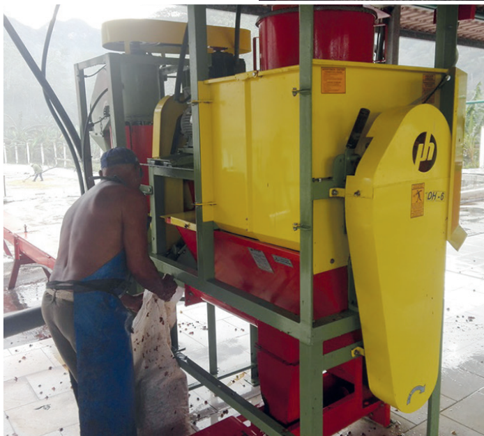
La Despulpadora San Blas lleva cinco años consecutivos siendo la mejor de Cuba.

El Banco de Semillas Certificadas de Café Mayarí aporta al balance nacional tres toneladas, tras satisfacer la demanda productiva de Cienfuegos.