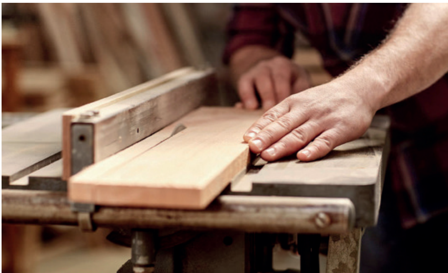
La carpintería es uno de los oficios más demandados en la actualidad.

Dentro de ese contexto, la prosperidad económica de Cienfuegos exigía el desarrollo de esos quehaceres a lo largo del siglo XIX. Los primeros antecedentes de ese tipo de enseñanza en la provincia remiten a la Escuela del Hogar de Santo Tomás y a la Escuela de Artes y Oficios de San Lorenzo, ubicadas en las calles de Santa Isabel y de San Carlos, respectivamente, abiertas a los alumnos entre 1929 y 1932.