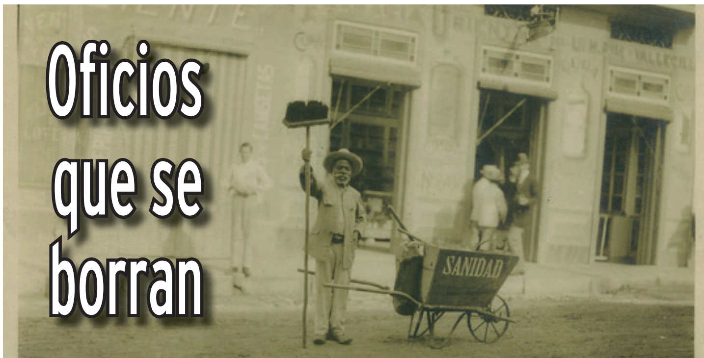
Foto tomada aproximadamente en 1899 (la original se encuentra en el Museo Provincial de Cienfuegos), en la calle De Clouet, entre San Carlos y Santa Cruz, frente a la Farmacia Oriental.