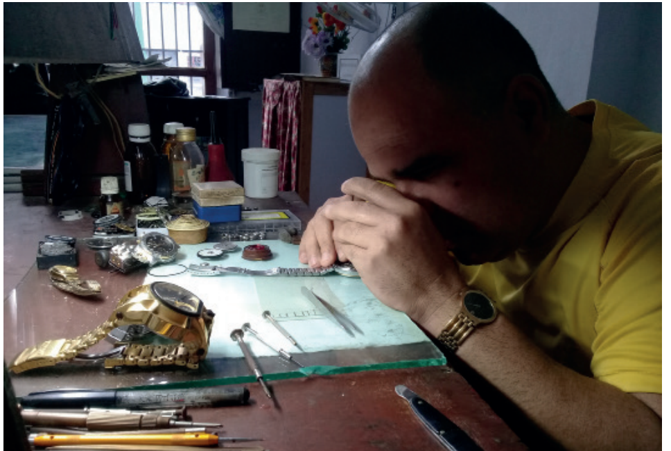
Al decir de Roger Gil Desada, no existen casi maestros relojeros en la ciudad.