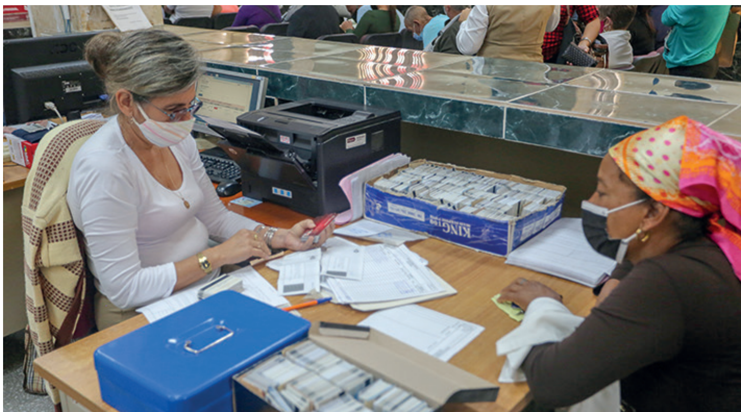
El principal desafío ahora descansa en la elevada responsabilidad de la institución en la Tarea Ordenamiento.

Entre los aciertos de Bandec Cienfuegos durante 2020 figura el nuevo récord en la cartera de préstamos provincial, con un cumplimiento del 127 por ciento, superior al de 2019. También crecieron las cuentas operadas por tarjetas magnéticas, las operaciones a través de canales de pago electrónico y el total de cuentas bancarias, así como la entrega de tarjetas matrices para utilizar los canales de pago electrónico.